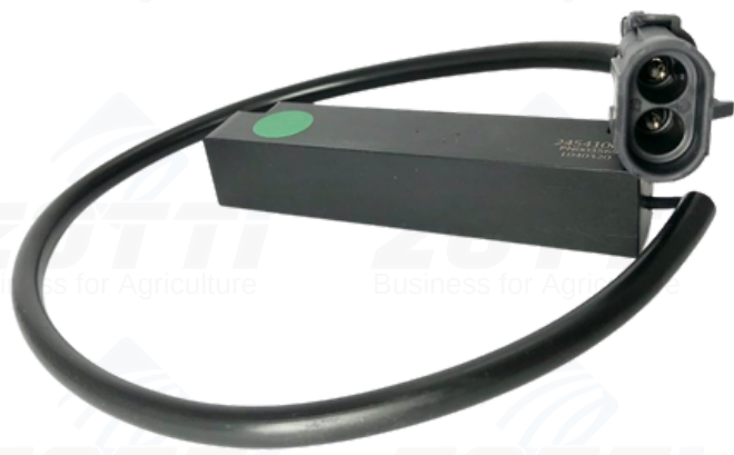
Z3090- SENSOR MAGNETICO DO KIT DO PICADOR CASE: 245410C1