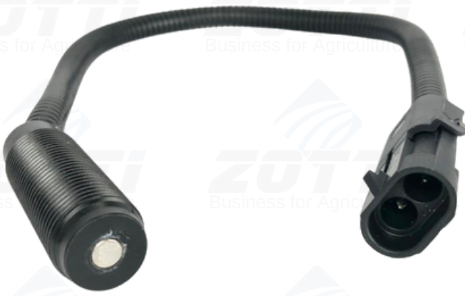
Z3088- SENSOR ELETRICO DE RPM CASE: 245193C1