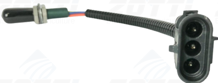
Z3094 - SENSOR RPM DO PICADOR / SENSOR DE ROTACAO M12X1 3 FIOS CASE: 87650675