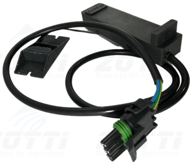
Z3092- SENSOR DE SEMENTES CASE: 404831A1